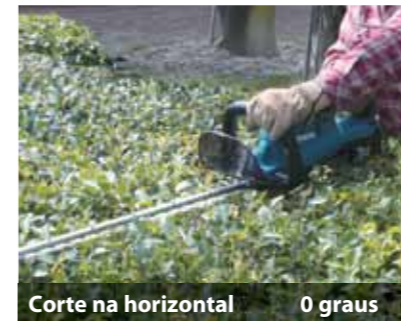
Corte na horizontal 0 graus

simplesmente carregando a bateria e acionando o interruptor.