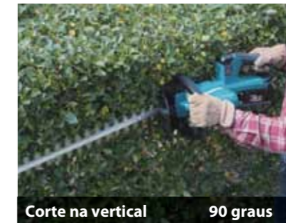
Corte na vertical 90 graus