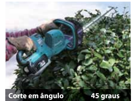
Corte em ângulo 45 graus